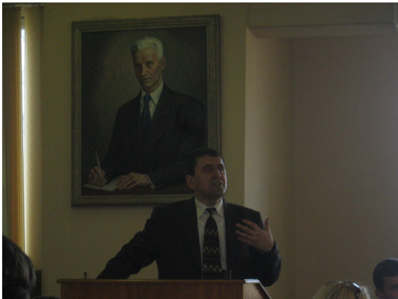
На захисті докторської дисертації в Інституті українознавства ім. І.Крип'якевича НАН України, 14 жовтня 2014 р.