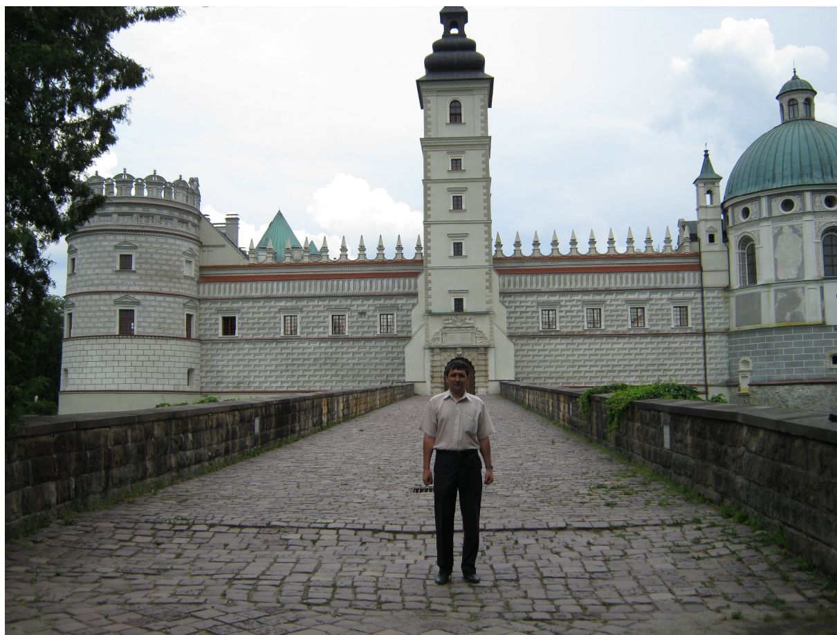
На міжнародній науковій конференції в Перемишлі. Під час екскурсії в Замок у Красичині, липень 2013 р.