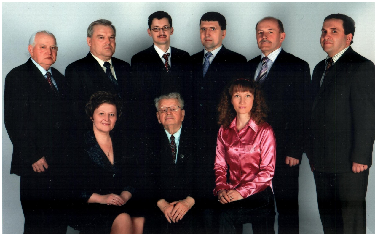
Викладацький колектив кафедри історії України, 2010 р.