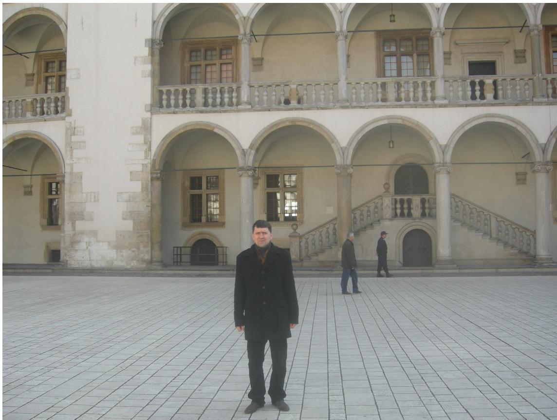
Під час наукового стажування в Ягеллонському університеті (м. Краків). У Королівському замку на Вавелі, травень 2012 р.