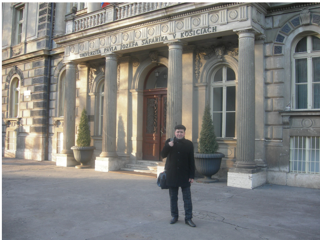
Під час наукового стажування у Словаччині, біля входу в Університет П.Й. Шафарика в Кошице, січень 2014 р.