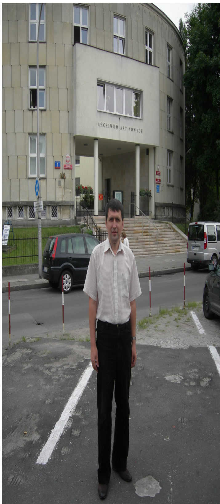
Під час наукового стажування в Польщі, біля входу в Архів актів нових у Варшаві, серпень 2010 р.