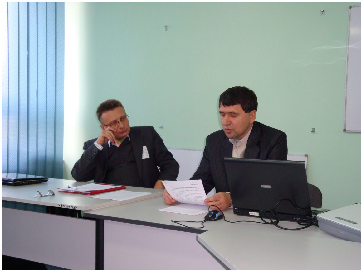
На міжнародній науковій конференції в Жешуві (Польща), жовтень 2011 р.